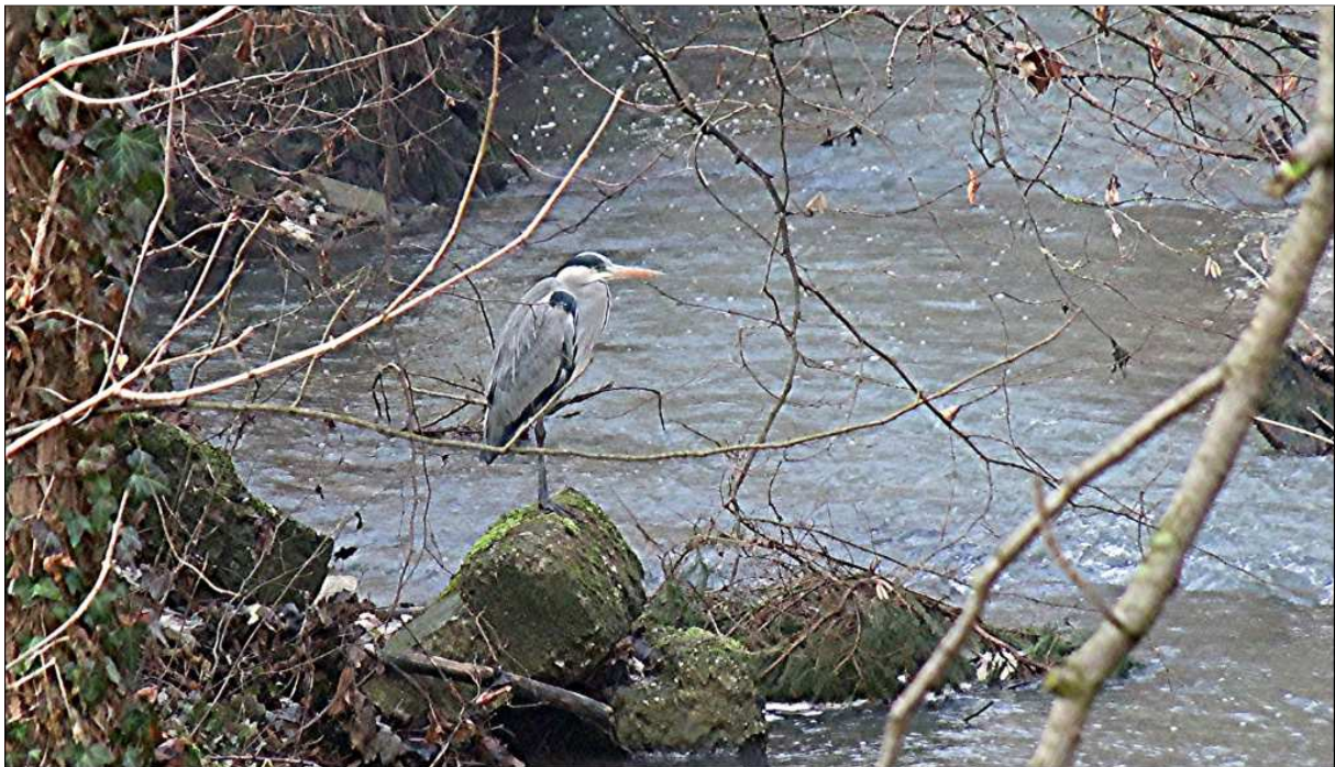
Abb. 3: 1ad. Ind. Graureiher Ardea cinerea im SK>PK; Datum: 12.01.2014; Ort: Winnenden