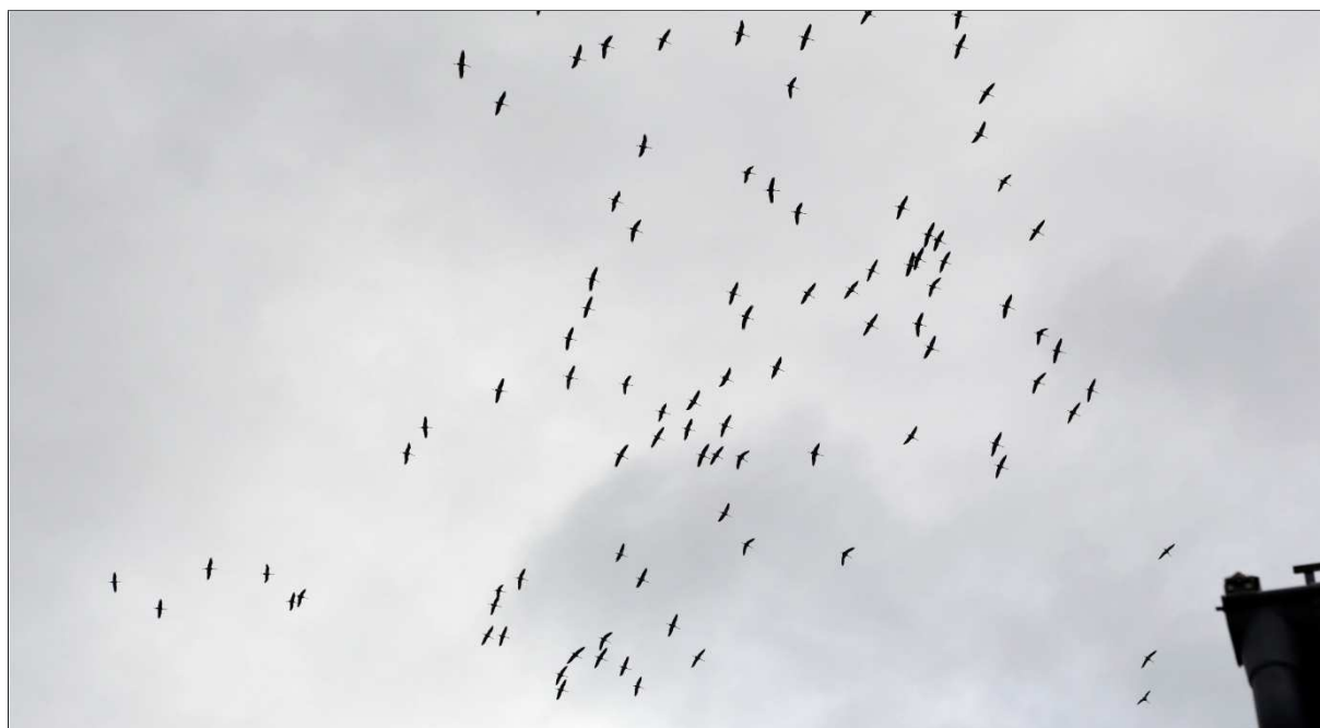
Abb. 4: 92 Ind. Kraniche Grus grus eines Zugverband mit insgesamt ca. 160 Ind.; Datum: 02.11.2013; Ort: Bürg