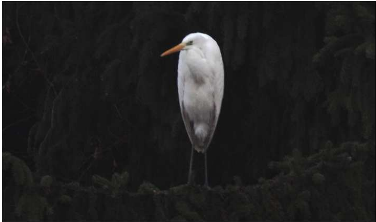
Abb. 1: 1 Ind. Silberreiher Ardea alba im SK; Datum: 12.01.2014; Ort: Hüttenbühlsee