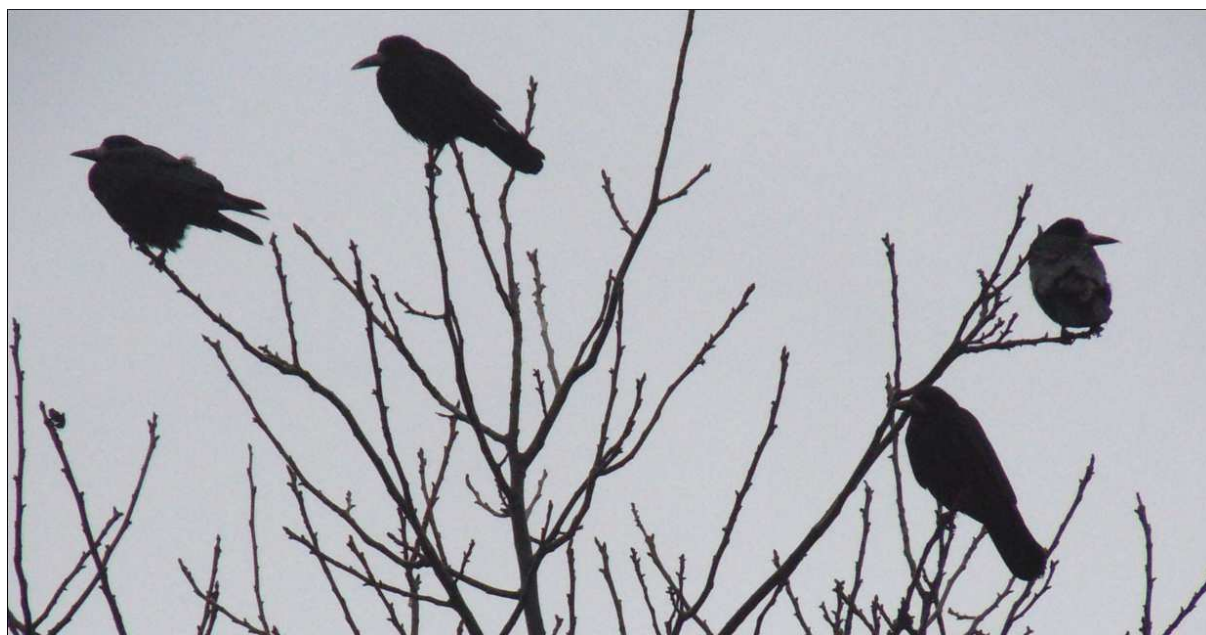
Abb. 5: 4 Ind. Saatkrähen Corvus frugilegus ruhend.; Datum: 24.01.2014; Ort: Winnenden