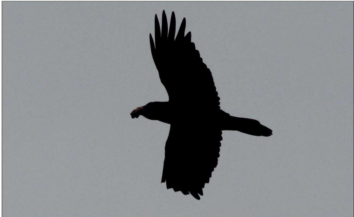
Abb. 6: 1 Ind. Kolkrahe Corvus corax transportiert im Kehlsack und im Schnabel Fleisch; Datum: 26.01.2014; Ort: Alfdorf