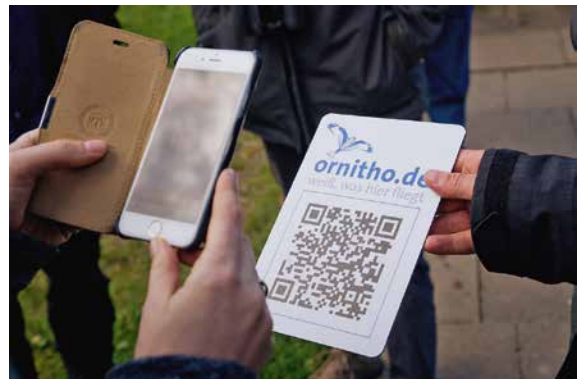
QR-Code-Schilder informieren nun über aktuelle Vogelbeobachtungen in der Wedeler Marsch.