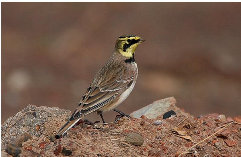
Aufgrund rückläufiger Rastbestände in Deutschland steht die Ohrenlerche als „stark gefährdet“ auf der Roten Liste wandernder Vogelarten.

Wir danken allen Koordinatorinnen und Koordinatoren sowie allen Mitarbeiterinnen und Mitarbeitern am Monitoring rastender Wasservögel aufs Herzlichste für ihre oft jahrzehntelange Unterstützung! Dank Ihrer Mitarbeit standen für die hierzulande auftretenden Wasservogelarten sehr gute Daten für die Gefährdungseinstufung zur Verfügung. Weiterhin danken wir allen Expertinnen und Experten, die ihr Wissen über die Bestandsentwicklung wandernder Vogelarten in die Rote Liste wandernder Vogelarten einbrachten.