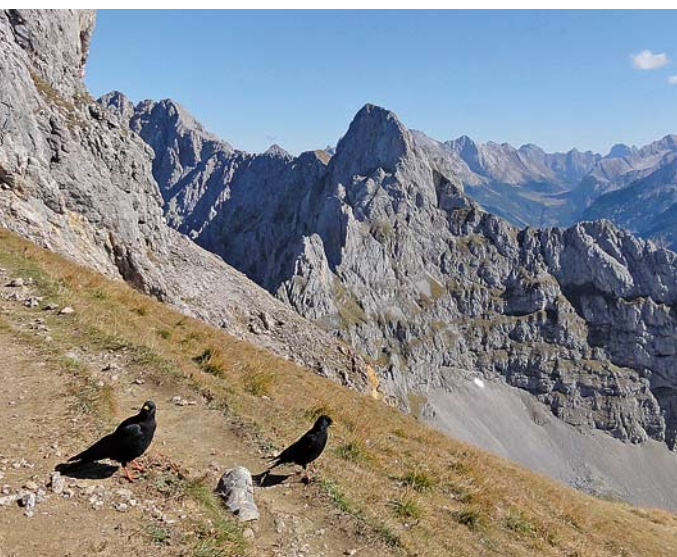
Alpendohlen – hier an der Westlichen Karwendelspitze – zählen zu den 21 Vogelarten, die im Mittelpunkt des Pilotprojektes stehen.

Auch aus dem Jahr 2012 sind bereits viele Nachweise seltener Vogelarten gemeldet worden. Doch es dürften noch weitere Sichtungen in Ihren Notizbüchern oder bei ornitho schlummern, deren Beobachtungsumstände noch nicht dokumentiert sind. Deshalb möchten wir Sie bitten, die Dokumentationen bis zum 31. Juli 2013 an die DAK zu senden. Zur Dokumentation bundesweit dokumentationspflichtiger Arten nutzen Sie bitte den vorgefertigten Meldebogen, den Sie auf den Internetseiten der DAK unter www.dda-web.de/dak finden. Bitte senden Sie den ausgefüllten Bogen entweder per Mail oder auf dem Postweg an die untenste-