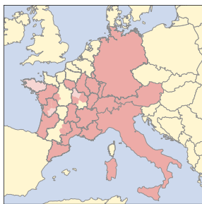
Aktuelle Verbreitung von ornitho -Systemen in Europa.

Seit dem 22. Mai ist ornitho.at online! Damit verfügt der gesamte deutschsprachige Raum, sowie mit Ausnahme Sloweniens, auch der gesamte Alpenraum über ein einheitliches Erfassungssystem für Zufallsbeobachtungen von Vögeln. Wir freuen uns bereits auf die länderübergreifenden Auswertungen, die damit in greifbare Nähe rücken. Ornitho.at wird von BirdLife Österreich betrieben und verfolgt die gleichen Ziele wie auch die übrigen ornitho -Portale: Es sollen Menschen für die Erfassung der Vogelwelt begeistert, an der Vogelwelt Interessierte zusammengeführt und ihre Vogelbeobachtungen für wissenschaftliche Auswertungen und Naturschutzangelegenheiten verfügbar gemacht werden. Im Frühjahr 2013 starteten in Österreich auch die Kartierungen zum neuen Brutvogelatlas, bei denen ornitho.at eine tragende Rolle spielen wird. Wir wünschen ornitho.at einen reibungslosen Start und allen Beobachterinnen und Beobachtern viele neue, spannende Einblicke in das vogelkundliche Geschehen!