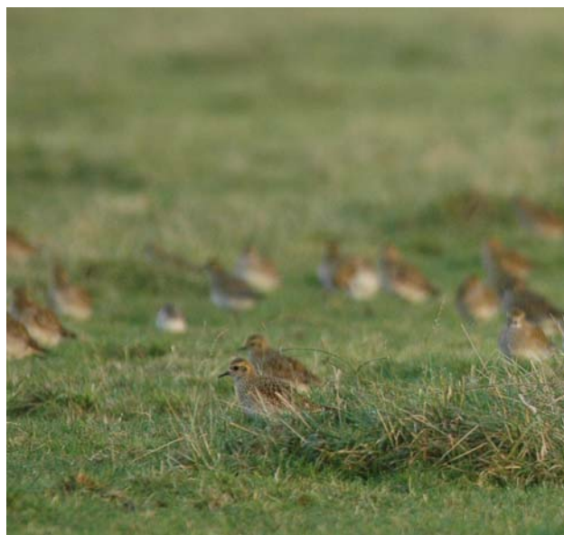
Rastende Goldregenpfeifer auf Grünland.