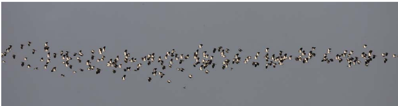
Ziehende oder über das Gebiet fliegende Individuen (hier Kiebitze) sollten ebenfalls notiert, aber deutlich als überfliegend oder ziehend (mit Richtung und Uhrzeit) angegeben werden. Dann lässt sich bei der Datenauswertung leichter eine Entscheidung treffen, ob diese andernorts auch gezählt wurden oder zur Gesamtsumme hinzuaddiert werden können.

Neben dem Gesamtbestand im Zählbereich sollten die Beobachtungen der einzelnen Trupps in den dafür vorgesehenen Feldern in der unteren Hälfte des Zählbogens eingetragen werden. Bitte verorten sie die Trupps einzeln in der Karte. In bislang nicht als Zählgebiet definierten Rastgebieten bitte unbedingt den erfassten Bereich in eine Skizze/Karte eintragen (in etablierten Gebieten optional). Diese Informationen sind zur Vermeidung von Doppelzählungen und aus Naturschutzsicht wichtig. Falls der Platz auf dem Zählbogen nicht ausreicht, verwenden Sie bitte den Zusatzbogen.