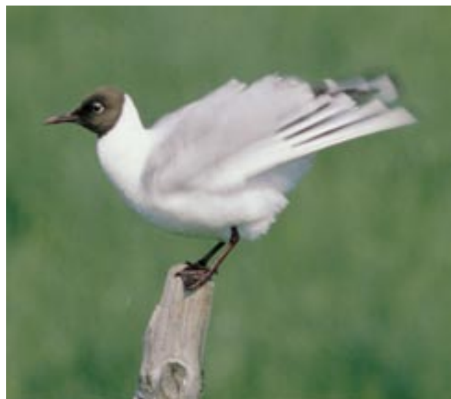
Eine Zählung der Lachmöwenkolonien in Deutschland war längst überfällig, denn die Bestände gehen zurück.

Die Lachmöwe wird vielleicht einmal ein Fall für die Rote Liste. Das war klar, als Mitte der 1990er Jahre die Brutbestände in weiten Teilen Deutschlands und in fast allen Nachbarländern auffällig zurückgegangen waren. Aber die neuen quantitativen Gefährdungskriterien für die Rote Liste der Vögel, die 1996 erstmals angewandt wurden, verlangen für die Einstufung Bestandszahlen. Für die Lachmöwe fehlten sie jedoch.