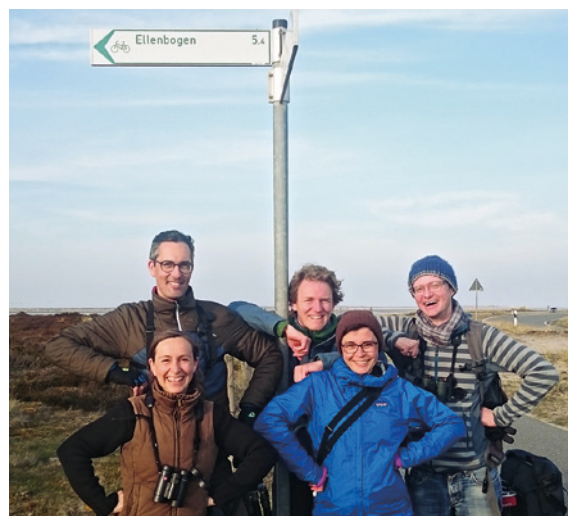
Wie immer ohne Rücksicht auf Verluste und Vergnügen ging's beim Birdrace auch dieses Jahr zu ... Da müssen selbst die beinharten Ellenbogenchecker herzhaft lachen. Wir freuen uns schon jetzt auf den 5. Mai 2018!

Im Spendenrennen ließen die BO-BACHTER im deutschlandweiten Vergleich mit 4.712 Euro einmal mehr nichts anbrennen und gewannen zum vierzehnten Mal und wieder mit einer neuen Bestmarke.